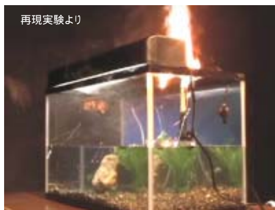
発煙約30分後、類焼する水槽用照明器具